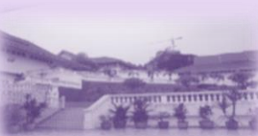
Bangunan Residen di Memorial Tunku Abdul Rahman Putra, Jalan Dato' Onn, Kuala Lumpur.